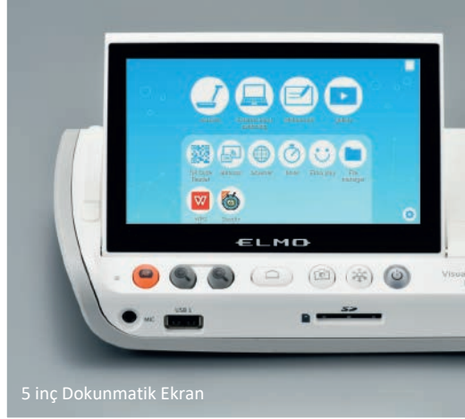
5 inç Dokunmatik Ekran