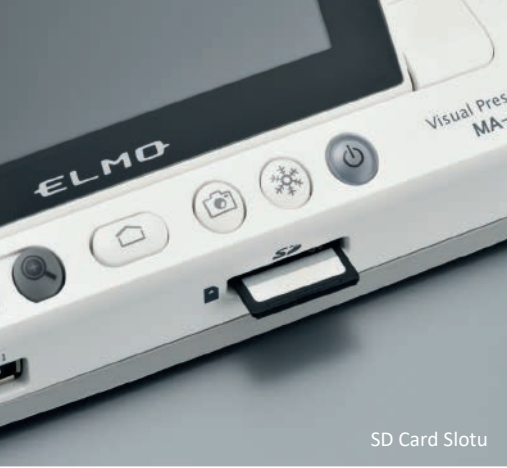
SD Card Slotu